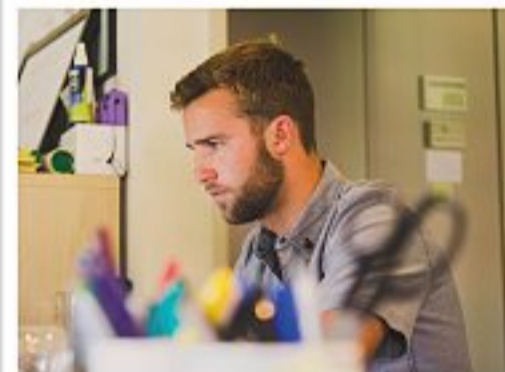
Il bando Un'iniziativa per i giovani

Hub per i ragazzi Attenzione anche alle reti e agli spazi di aggregazione per i ragazzi