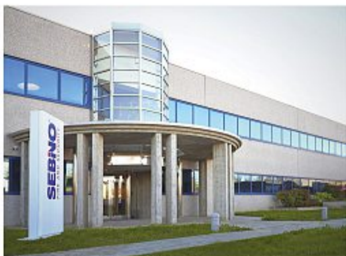
Headquarter L'azienda ha sede a Madone, in provincia di Bergamo